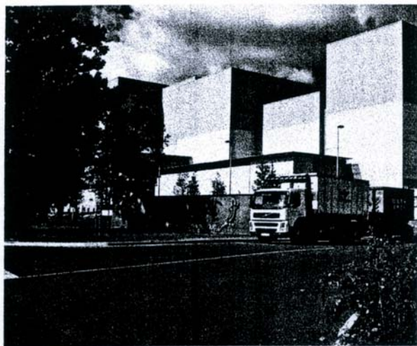
La centrale Salamandre traite notamment les ordures ménagères et produit 60 000 MW d'électricité par an

résiduel », explique Patrice Foucaud, président du Sivert. La centrale Salamandre traite non seulement les ordures ménagères (64 000 tonnes par an), mais aussi les encombrants (24 000 tonnes) et les boues de sta-